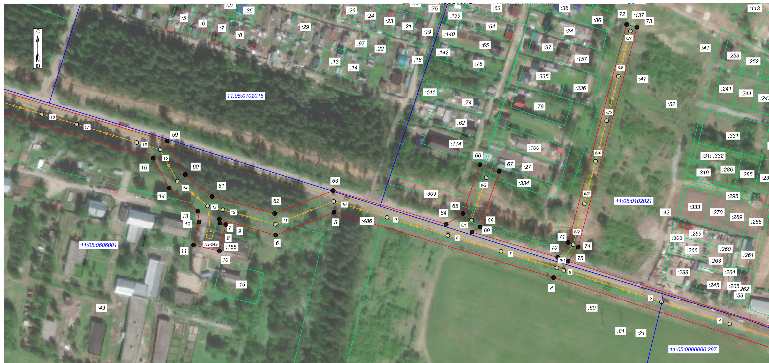
Схема расположения границ публичного сервитута: ВЛ 10 кВ от ТП 10/0,4 кВ №195 через ТП 10/0,4 кВ №№249, 248, 356, 299, РП 10 кВ №25 до ТП 10/0,4 кВ №247 в м. Дырнос г. Сыктывкара с центром питания от яч. 135 ПС 110/10 кВ "Западная"