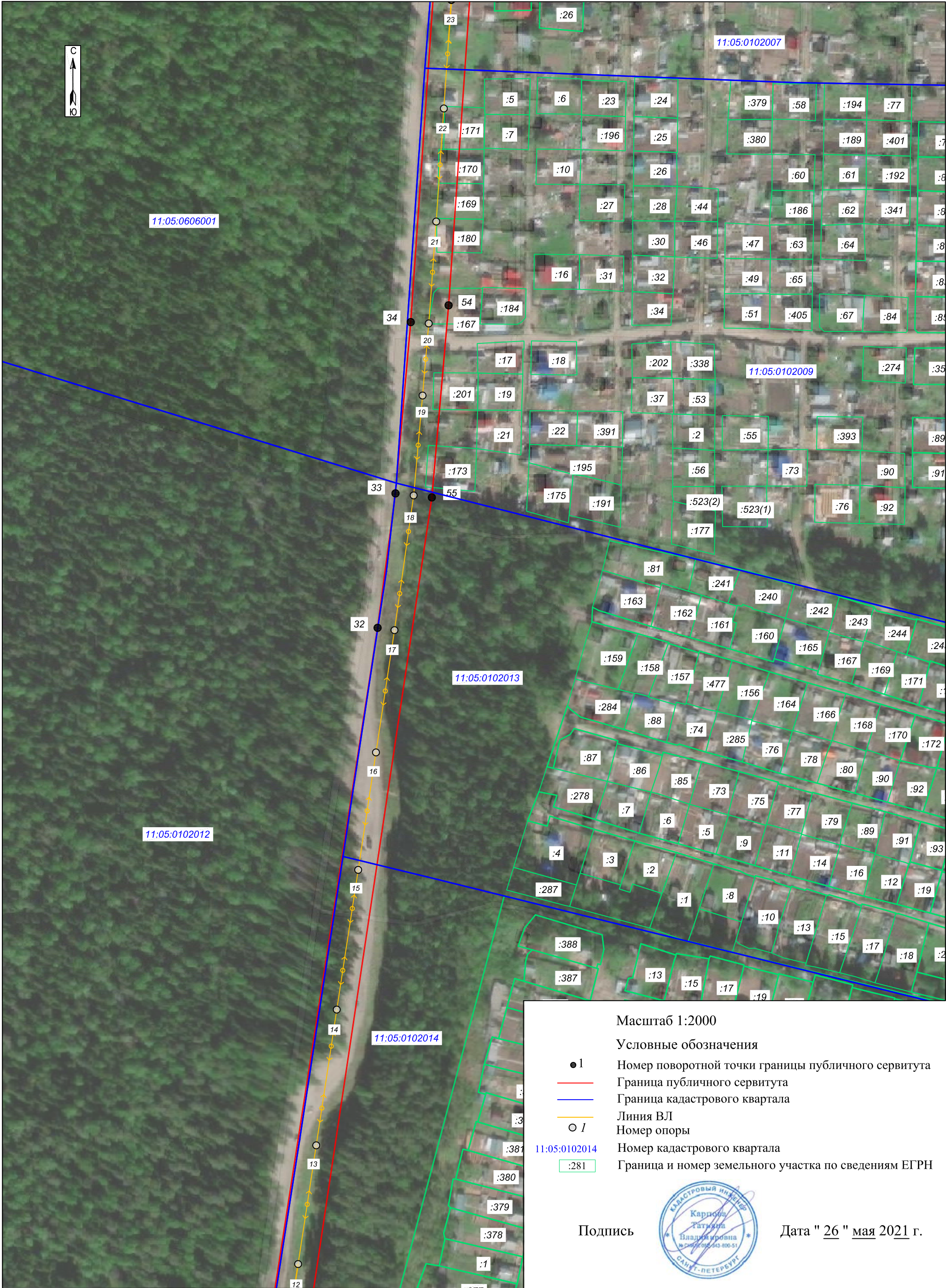
Схема расположения границ публичного сервитута: ВЛ 10 кВ от ТП 10/0,4 кВ №195 через ТП 10/0,4 кВ №№249, 248, 356, 299, РП 10 кВ №25 до ТП 10/0,4 кВ №247 в м. Дырнос г. Сыктывкара с центром питания от яч. 135 ПС 110/10 кВ "Западная"