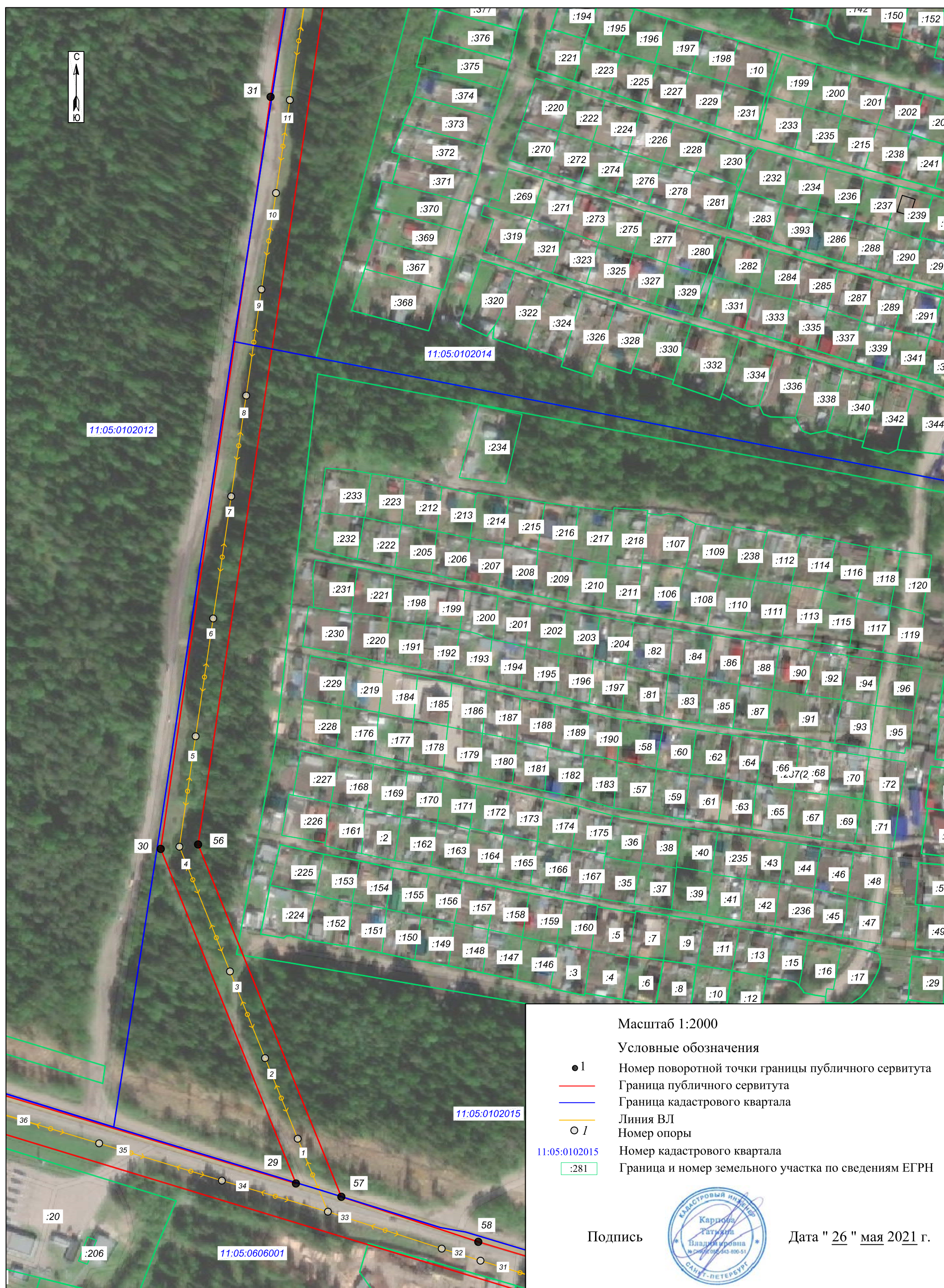
Схема расположения границ публичного сервитута: ВЛ 10 кВ от ТП 10/0,4 кВ №195 через ТП 10/0,4 кВ №№249, 248, 356, 299, РП 10 кВ №25 до ТП 10/0,4 кВ №247 в м. Дырнос г. Сыктывкара с центром питания от яч. 135 ПС 110/10 кВ "Западная"