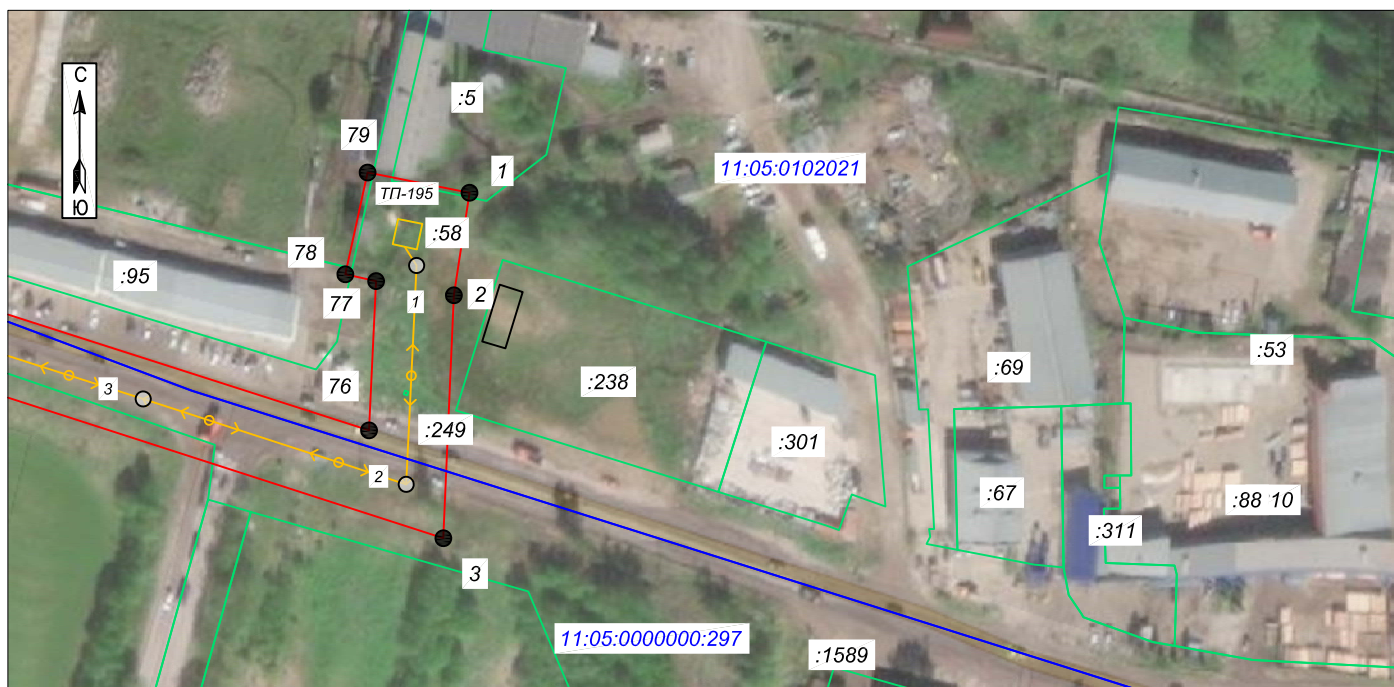
Схема расположения границ публичного сервитута: ВЛ 10 кВ от ТП 10/0,4 кВ №195 через ТП 10/0,4 кВ №№249, 248, 356, 299, РП 10 кВ №25 до ТП 10/0,4 кВ №247 в м. Дырнос г. Сыктывкара с центром питания от яч. 135 ПС 110/10 кВ "Западная"