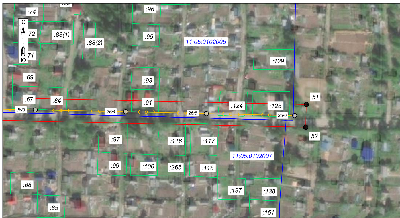
Схема расположения границ публичного сервитута: ВЛ 10 кВ от ТП 10/0,4 кВ №195 через ТП 10/0,4 кВ №№249, 248, 356, 299, РП 10 кВ №25 до ТП 10/0,4 кВ №247 в м. Дырнос г. Сыктывкара с центром питания от яч. 135 ПС 110/10 кВ "Западная"